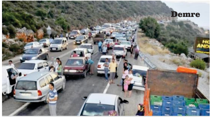
Ulusal basın kuruluşlarının, Antalya'nın Demre ilçesinde çekilen fotoğrafı, "Fethiye'den büyük kaçış" başlığıyla yayınlamaları bölge turizmine çok ciddi zararlar verdi.

FTSO tarafından deprem öncesi ve sonrası alınması gereken önlemler konusunda yapılan girişimler 10 Haziranda yaşanan depremin ardından haklılığını ortaya çıkardı. 10 Haziran'da yaşanan depremde telefonlar kilitlendi, haberleşme bitti, sadece orman ve polis ekiplerinin telsiziyle haberleşme sağlanabildi. Toplumdaki ortak beklenti; eski binaların sağlamlığının ölçülmesi ile koordinasyonu sağlayacak kriz masasının oluşturulması için çalışmaların şimdiden başlatılmasında birleşiyor. 2011 Yılı'nın kasım ayında FTSO Meclisinin gündemine taşınan "İlçemiz olası bir depreme hazır mı?" konulu toplantıda, ilgili kurumların görüşleri ortaya konmuş, ilçemizde deprem öncesi ve sonrasında alınması gereken tedbirler belirlenmiş ve bunların yerine getirilmesi için ilgili kurumlara çağrıda bulunulmuştu. Toplantıdan çıkan sonuçlara göre yapılan çağrıda, olası bir deprem öncesinde alınması gereken tedbirlerin başında eski binaların sağlamlığının ölçülmesi için çalışma başlatılması ile depremden sonra koordinasyonu sağlayacak kriz merkezinin oluşturulması ve kurumların görevlerinin belirlenmesi gerektiği dile getirilmişti. Geçen süre içinde yapılmayan çalışmaların, alınmayan önlemler eksikliği ve ihtiyacı 10 Haziran'da yaşanan depremden sonra daha da fazla hissedildi. Özellikle kriz masasının